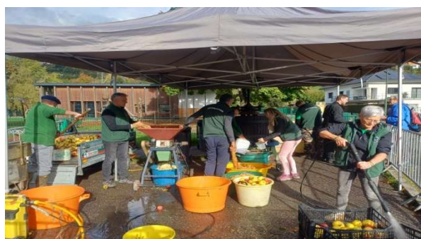
Fête de la pomme, 2025