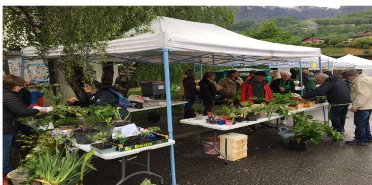
Troc aux plantes 2024